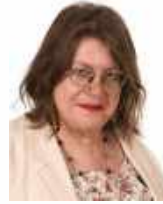
Elizabeth Car Bibliotheek