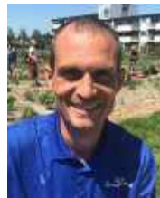
Anton Kruit Bewegings- onderwijs