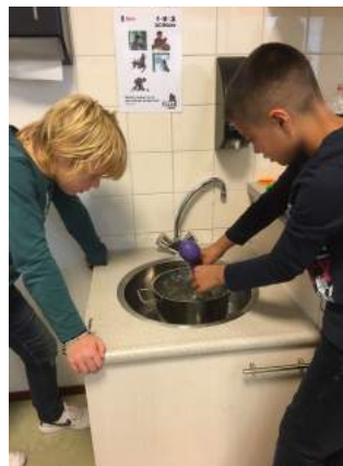
Activiteiten bij het thema "We gaan de lucht in"